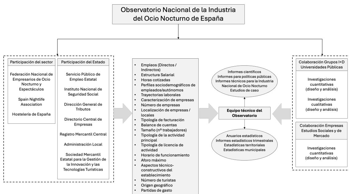
Figura 1. Estructura Operativa del Observatorio Nacional de la Industria del Ocio Nocturno de España